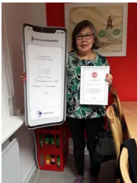
Sulisunut sinniisutsialak - Årets tillidsrepræsentant

De kårede tillidsrepræsentanter fik et diplom og et beløb på 3.000 kr. (efter skat).