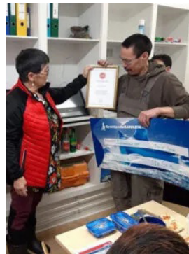
Sulisunut sinniisutsialak - Årets tillidsrepræsentant