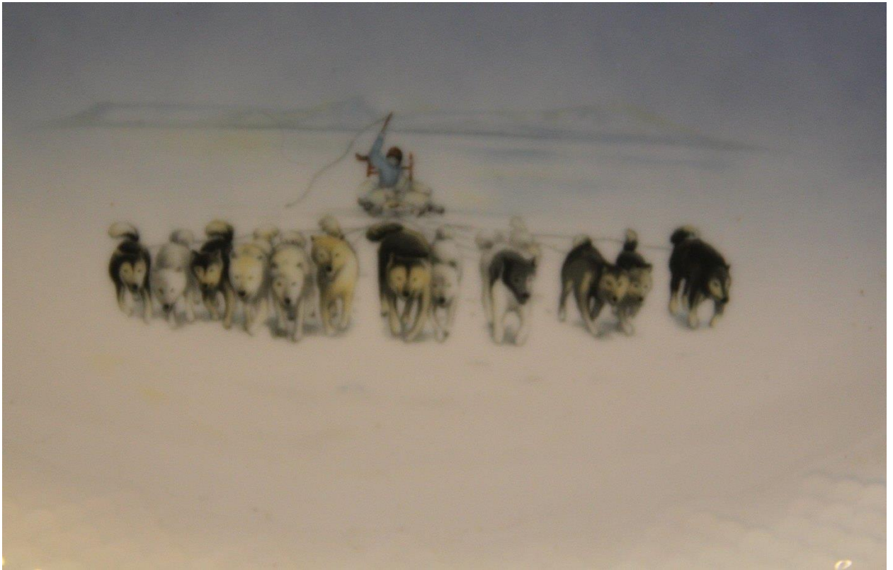
Qimusseq. Qamutit. Qimmit qimuttut. Iperaataq. Inuk. Qimmit inuat. Nipini qassarissoq atorlugu aqutsisoq. Siulersorti ataqqisassaq, ataqqeqatigiinnermik pilersitsisoq.